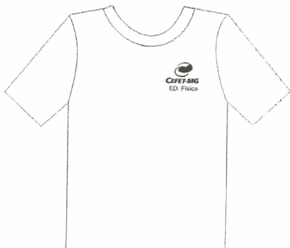
MOD 7 Ed. Física-237

Bermuda tactel azul marinho cor 38 Doptex, bolso na perna bordado VIVO LARANJA LADO